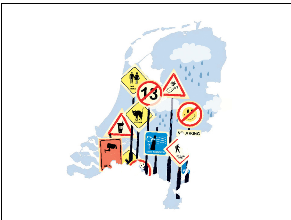
Illustratie: Sebe Emmelot

Kortom, de omgang met risico's en verantwoordelijkheden brengt bijzondere moeilijkheden met zich mee. Het programma R&V probeert het bestuurlijke en ambtelijke handelingsrepertoire in het omgaan met risico's en incidenten te verbreden, onder meer door inzicht te bieden in de werking van de risico-regelreflex en de daarmee samenhangende krachten en tegenkrachten.