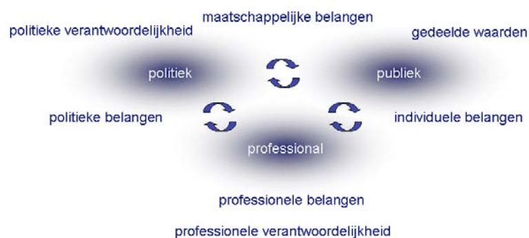
Figuur 1: een complex speelveld

Als een referentiepunt voor zijn handelen zou hij in principe moeten kunnen terugvallen op publiekelijk onderschreven, gedeelde waarden, maar in de praktijk is dat referentiekader diffuus, veelvormig en zelden praktisch van aard.