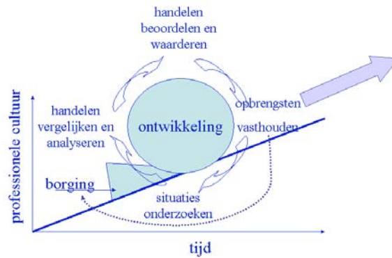
Figuur 2: het versterken van de professionele cultuur

Dit staat los van de mate en vorm van concreetheid die men in de loop van het proces voor het vastleggen van de opbrengsten in de organisatie nastreeft.