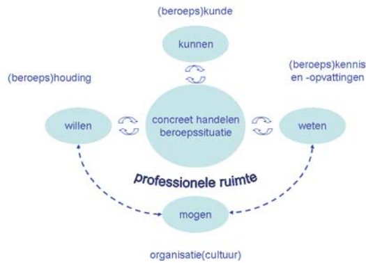
Figuur 4: factoren die gedrag bepalen

Hiermee hangt ook de valkuil van overmatig reguleren samen. Omdat situaties uniek zijn, heb je er meer aan als de ambtenaar bekwaam is om naar bevinding van zaken adequaat te handelen. Dit vraagt om professionele speelruimte, eenduidige gedragsvoorschriften zijn al snel contraproductief. 3