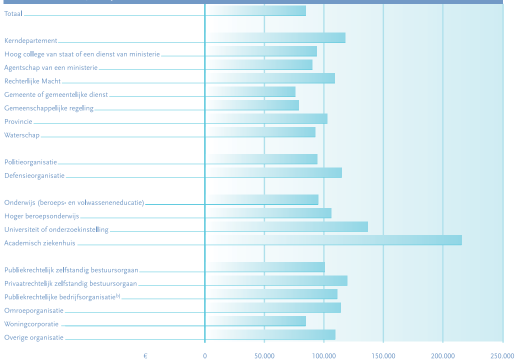
Grafiek 1 Gemiddeld jaarloon a) van topfunctionarissen in de (semi-)publieke sector en bij woningcorporaties naar sector, 2004

Min of meer eenzelfde beeld komt naar voren wanneer naar het gemiddelde jaarloon van een topfunctionaris wordt gekeken (zie ook grafiek 1). Absolute koploper waren de academische ziekenhuizen (€ 216.300). Op afstand volgden de universiteiten/ onderzoekinstellingen (€ 135.000), de privaatrechtelijke zelfstandige bestuursorganen (€ 119.100) en de kerndepartementen (€ 116.300). Hekensluiters waren de gemeenten/ gemeentelijke diensten (€ 76.600), vooraf gegaan door de gemeenschappelijke regelingen (€ 78.300). Opnieuw tellen de gemeenten/gemeentelijke diensten zwaar mee in het gemiddelde van de (semi-)publieke sector en woningcorporaties. Dit blijkt ook uit het feit dat alleen deze sector, de gemeenschappelijke regelingen en de woningcorporaties onder het gemiddelde liggen.